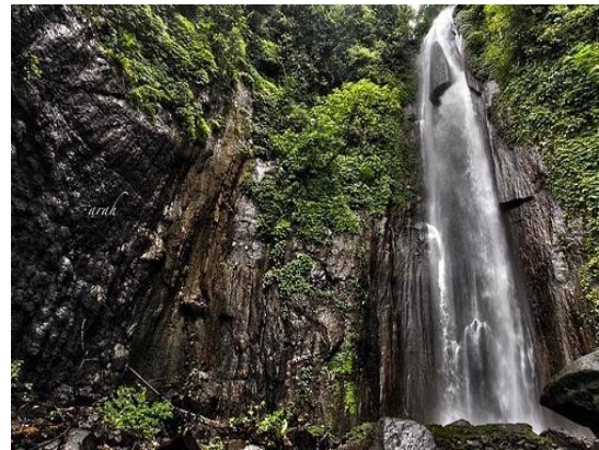
gambar 2 Coban Cunggu