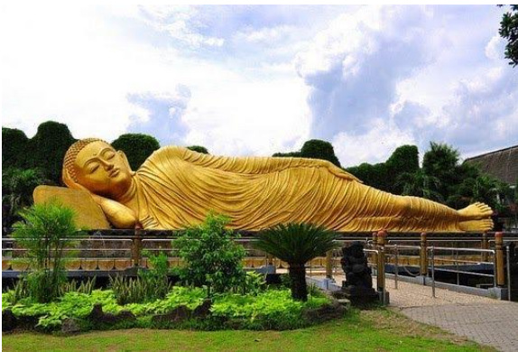
Gambar 3 Patung Budha Tidur