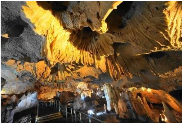
gambar 1 Guwa Maharani