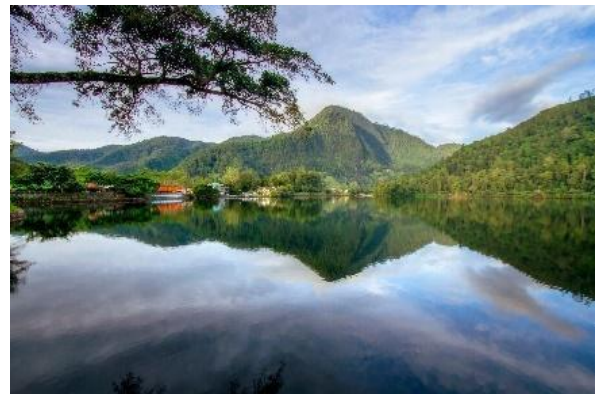
gambar 4 Tlaga Sarangan